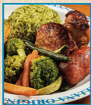
Sobrecoxa desossada • Ling Toscana, Arroz de Brócolis e Mix de Legumes

A MELHOR FORMA DE COMER MUITO BEM, POR UM PREÇO JUSTO E DO JEITO QUE VOCÊ QUISER. A ESCOLHA É SEMPRE SUA!