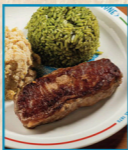
Contrafilé 220g com Arroz de Brócolis e Farofa de Ovos