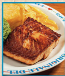
Salmão 250g com Arroz de Brócolis e Batata Portuguesa.