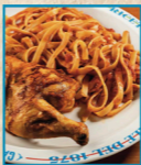
Meio Galeto com Fettuccini ao Molho Pomodoro